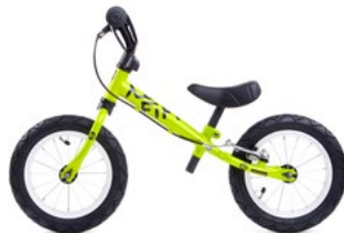
FIFTY B GREEN