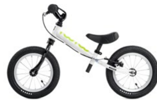
TOO TOO II WHITE BLACK