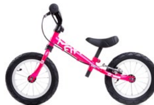
FIFTY B MAGENTA