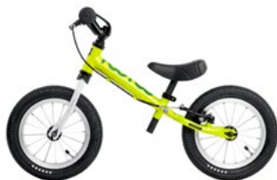
TOO TOO II GREEN WHITE