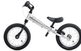
TOO TOO ALU WHITE