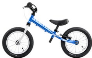
TOO TOO II BLUE WHITE

Varianta YEDOO TOO TOO I neobsahuje reflexní prvky.