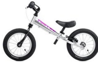
TOO TOO ALU MAGENTA