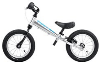
TOO TOO ALU BLUE