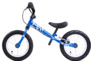
FIFTY B BLUE

Varianta YEDOO FIFTY A neobsahuje zadní V-brzdu.