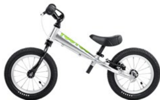
TOO TOO ALU GREEN