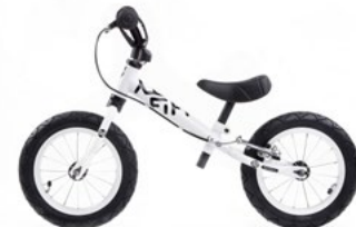
FIFTY B WHITE