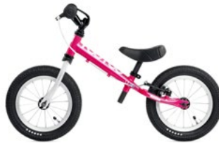
TOO TOO II MAGENTA WHITE